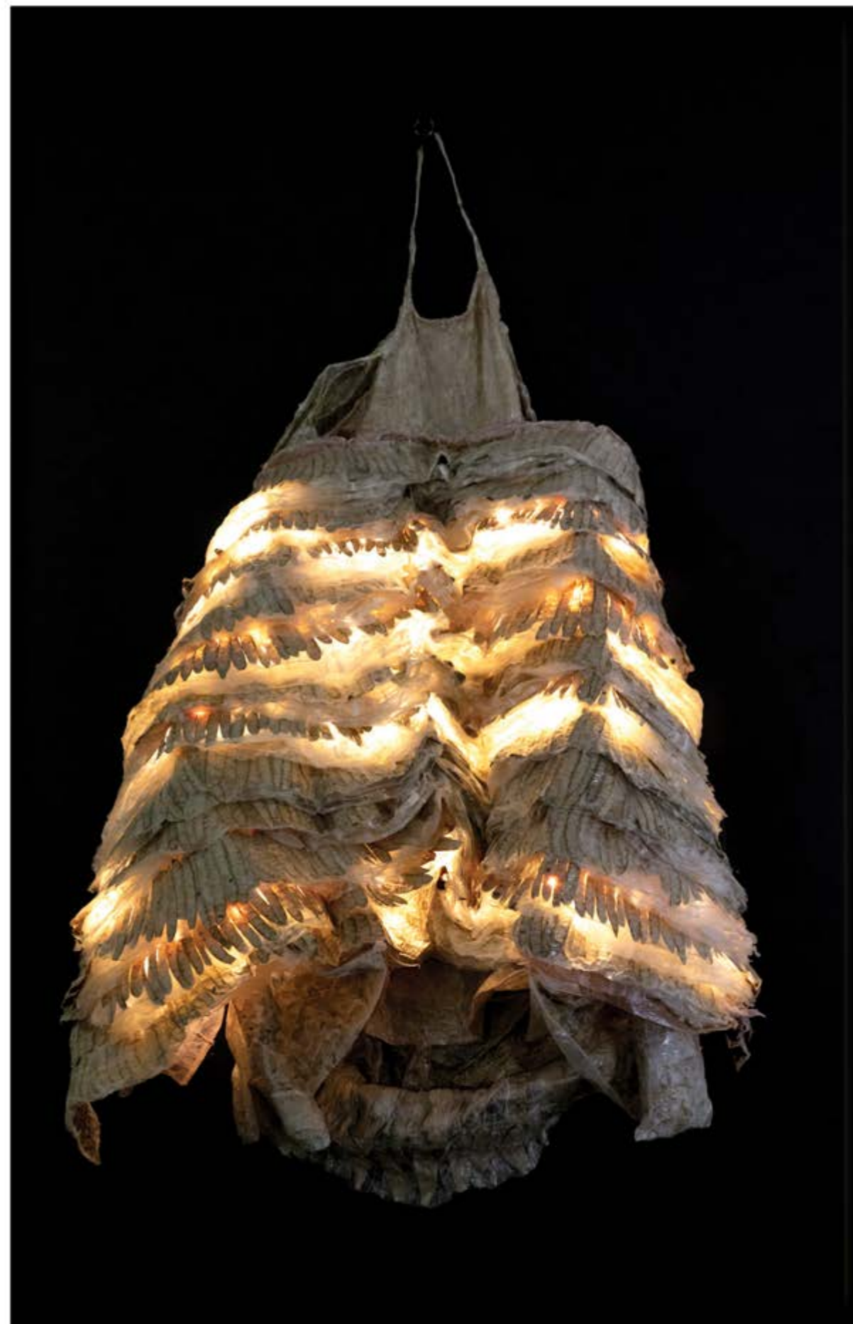
Chrysalide n° 18, dispositif sculptural mural 122 x 80 cm, composé d'une sculpture en résine 95 x 65 x 35 cm, panneau et éclairage