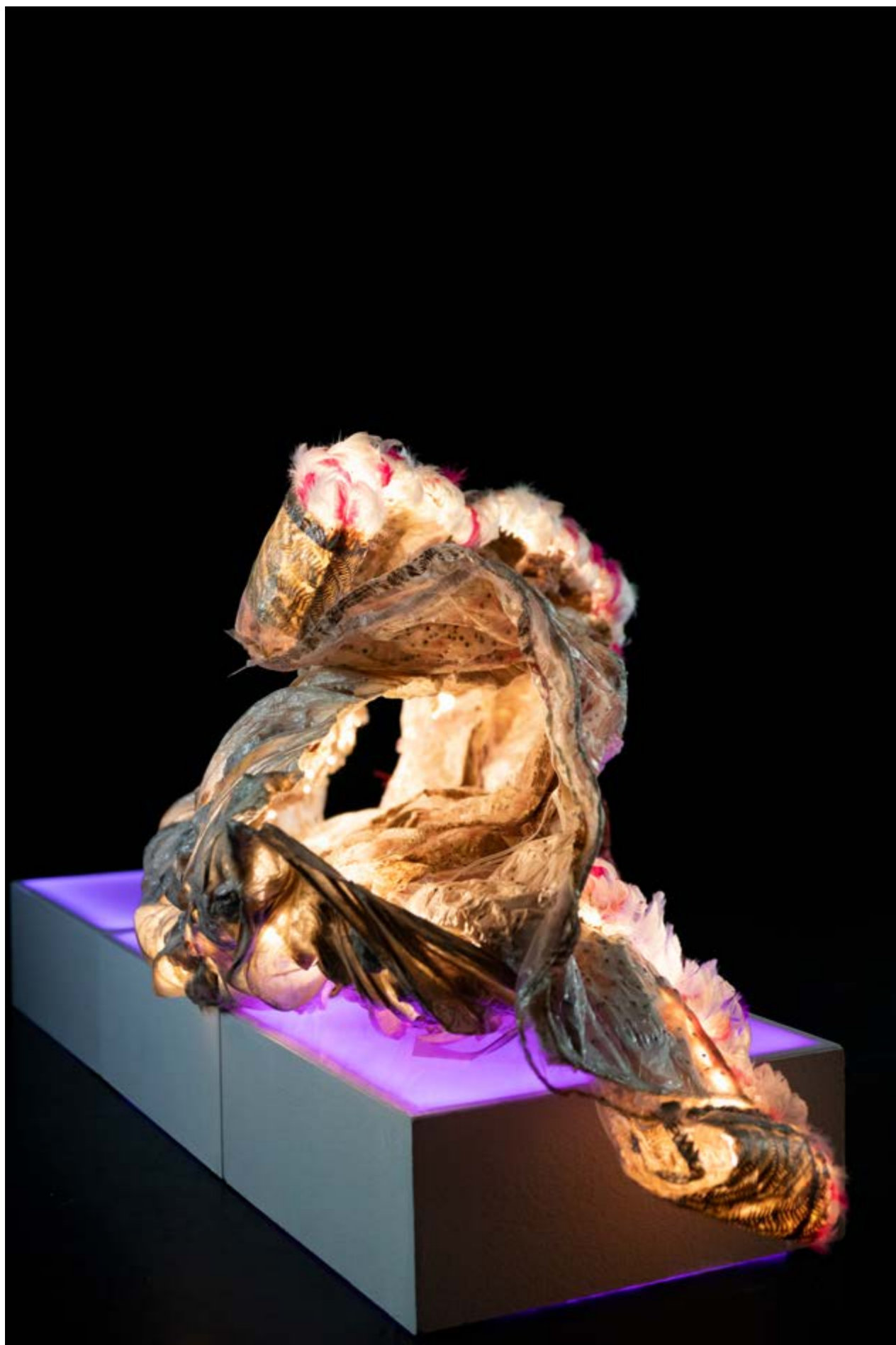
Nymphose n° 2, dispositif sculptural modulaire 80 x 180 x 90 cm, composé de 3 sculptures en résine, socle et éclairage