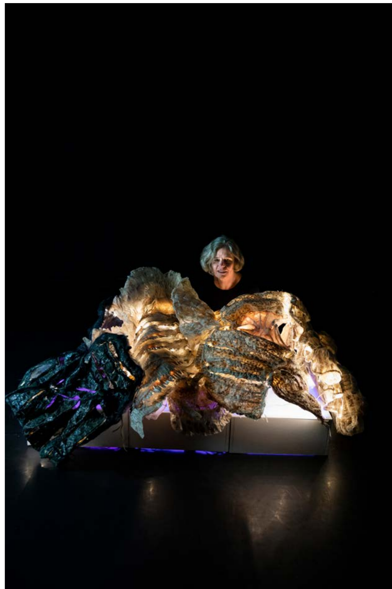
Nymphose n° 3, dispositif sculptural modulaire 80 x 180 x 100 cm, composé de 5 sculptures en résine, socle et éclairage