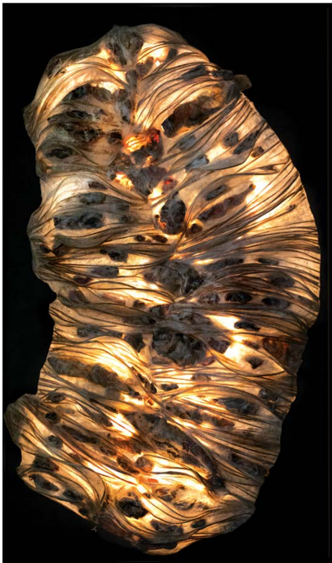
Chrysalide n° 3, dispositif sculptural mural 177 x 102 cm, composé d'une sculpture en résine 155 x 90 x 20 cm, panneau et éclairage