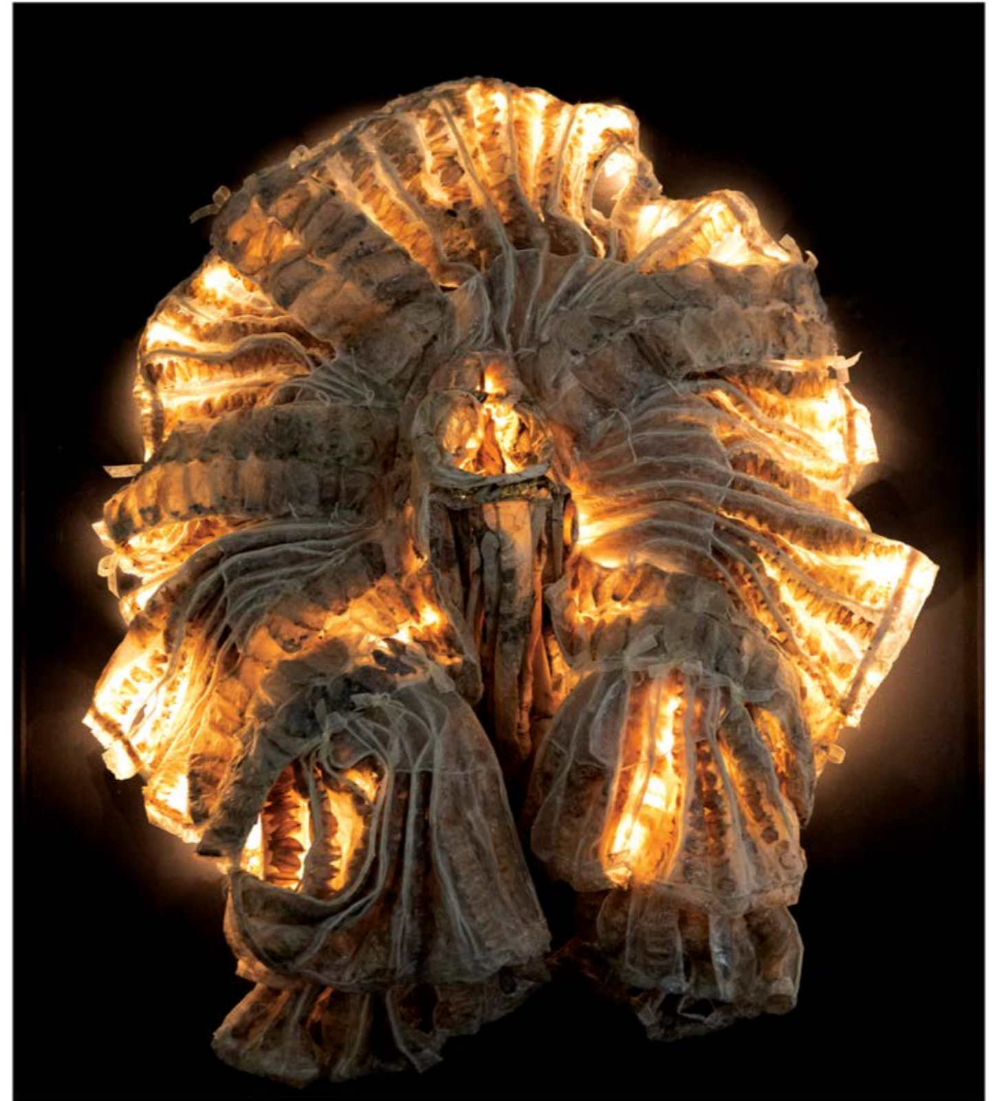
Chrysalide n° 17, dispositif sculptural mural 100 x 85 cm, composé d'une sculpture en résine 80 x 80 x 40 cm, panneau et éclairage